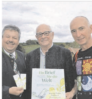
Mehr Fotos auf mistelbach.NÖN.at